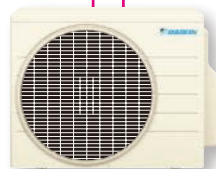
カラー:ホワイト(5Y 7.5/1) 室内機 / 高さ285・幅770・ 奥行233mm 室外機 / 高さ550・幅675(+90)・ 奥行284(+42)mm ( )内は突起物の寸法です。